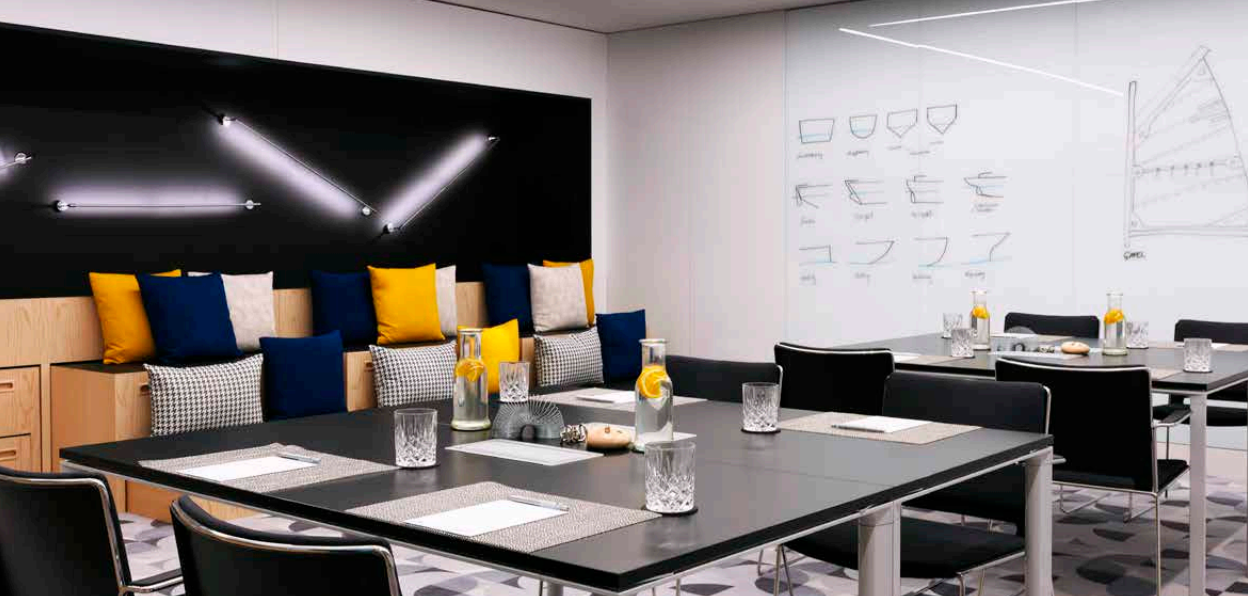
SALA KONFERENCYJNA 5